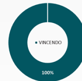
Posição de Recebíveis em Carteira